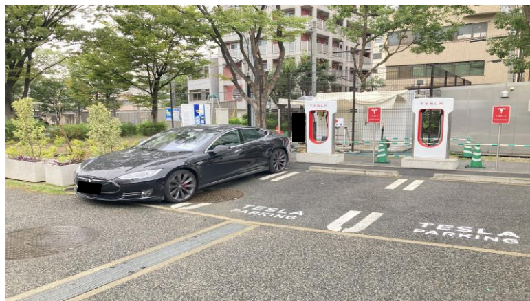
【テスラ スーパーチャージャー イメージ】