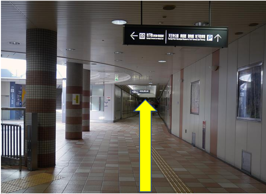
6. 駐車場入り口手前、左側に、エレベーターがあります