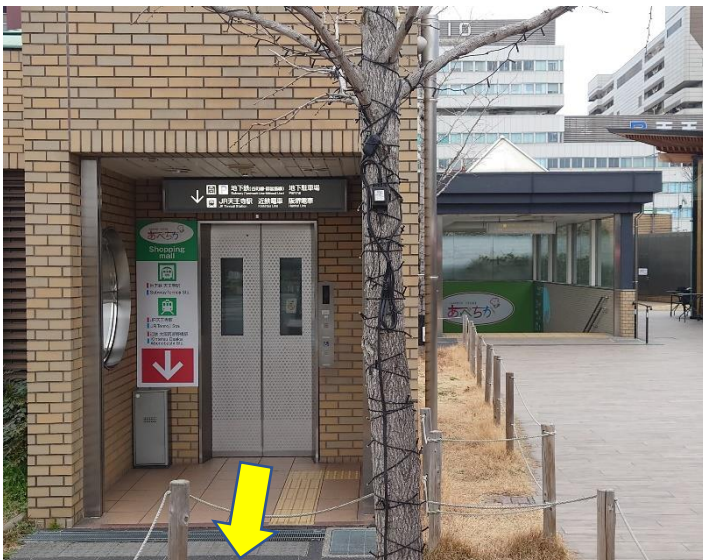
7. 地上階(てんしば内) 到着です。お疲れさまでした。どうぞお楽しみください。