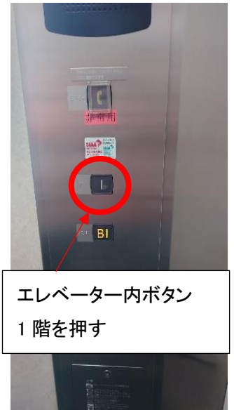
エレベーター内ボタン 1階を押す