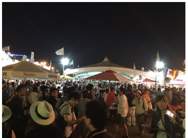
オクトーバーフェストの様子（2016年開催時）

本資料配付先：大阪建設記者クラブ、近畿電鉄記者クラブ、青灯クラブ、南大阪記者クラブ、関西レジャー記者クラブ