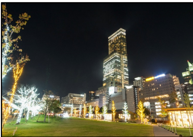
てんしばのイルミネーション（2017年開催時）

2018年3月29日（リニューアルオープンから約2年6か月）には総来園者が1,000万人を突破しました。その後も年間400万人を超えるペースでたくさんの方にご来園いただいております。地域の皆様だけでなく、関西圏広域の方々にお楽しみいただいております。今後も当社は「てんしば」が皆様に親しまれ、愛される場所になるよう、努めてまいります。