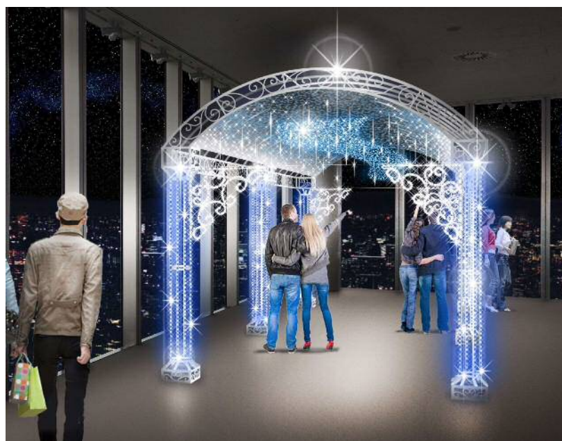
59階お帰りエレベーター前 アーチ型イルミネーション（イメージ）