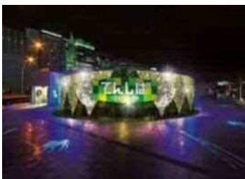
天王寺公園エントランスエリア てんしば