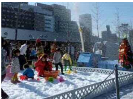
過去の雪あそびの様子