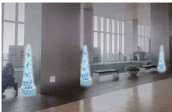
④あべのハルカス17階オフィスロビー