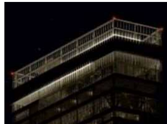
①トゥインクルライト