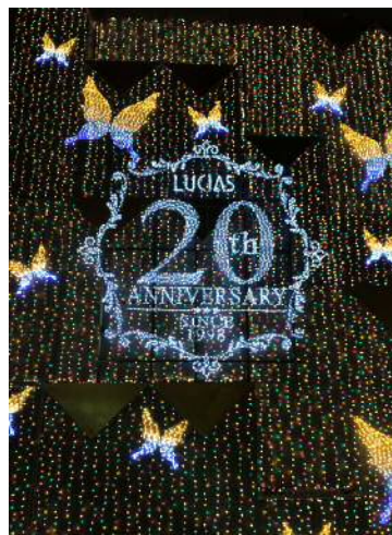
アポロビル・ルシアスビル