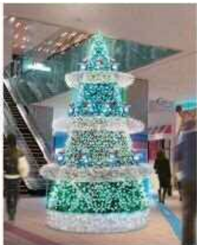
⑤あべのハルカス16階ロビー ※画像はイメージです。