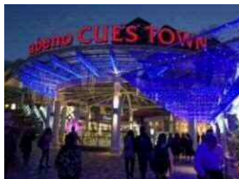
あべのキューズモール