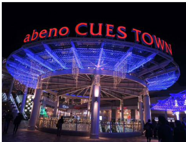
あべのキューズタウン