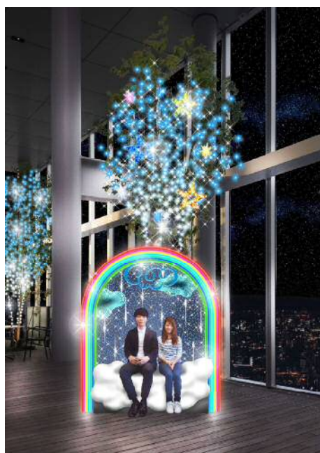
58階天空庭園 イルミネーションフォトスポット（イメージ）

今年の冬もまばゆい光に包まれた「あべのハルカス」、あべの・天王寺エリアでイルミネーションをお楽しみいただければと考えています。詳細は別紙のとおりです。