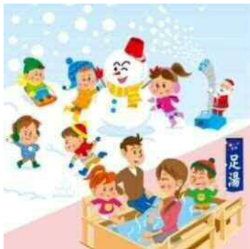
Welcomingアベノ・天王寺 ウィンタープレゼント2018 イメージイラスト