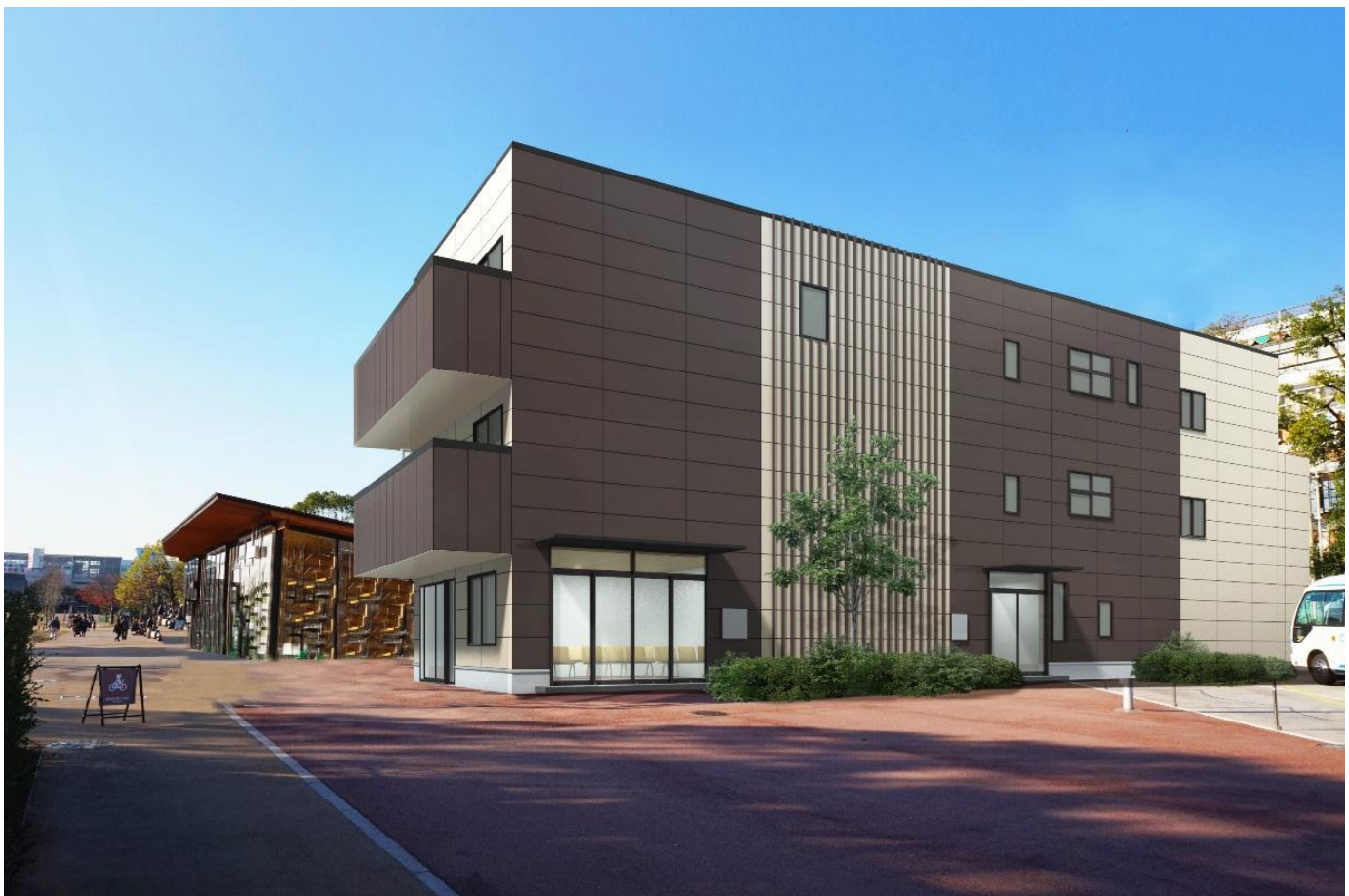
建物外観(完成予想CG)