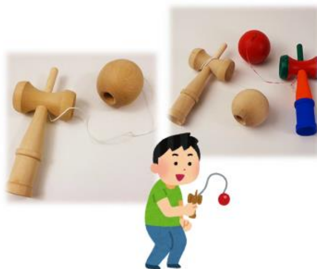
【昔あそびイメージ】