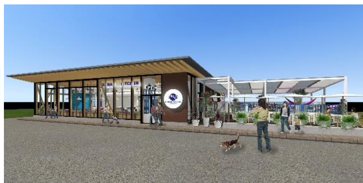
【SORAIRO KITCHEN in TENSHIBA PARK】 外観イメージパース