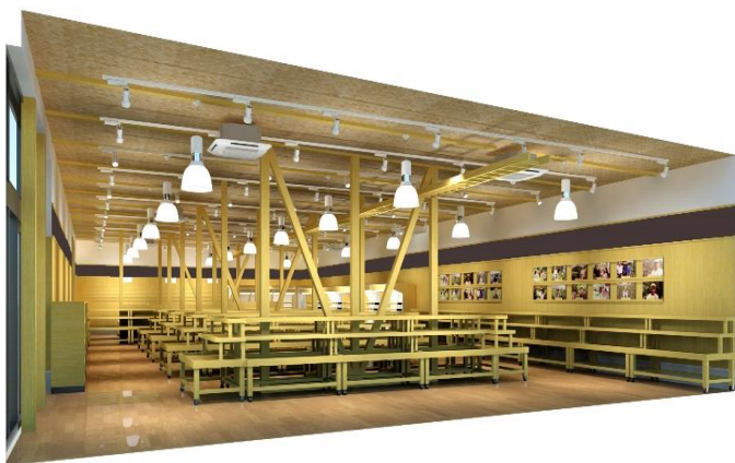
【産直市場 よってって】 店内イメージパース