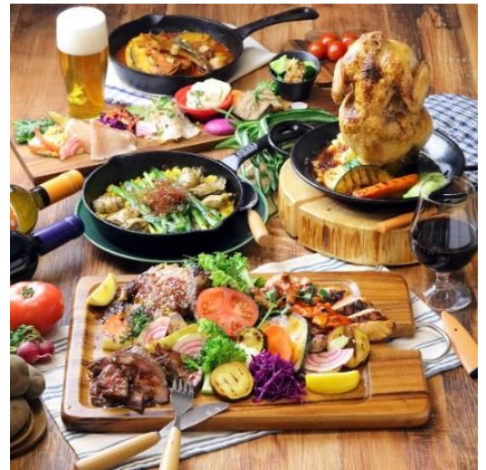
【料理提供イメージ】