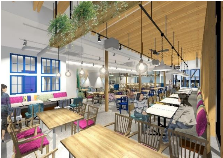
【店内イメージパース】