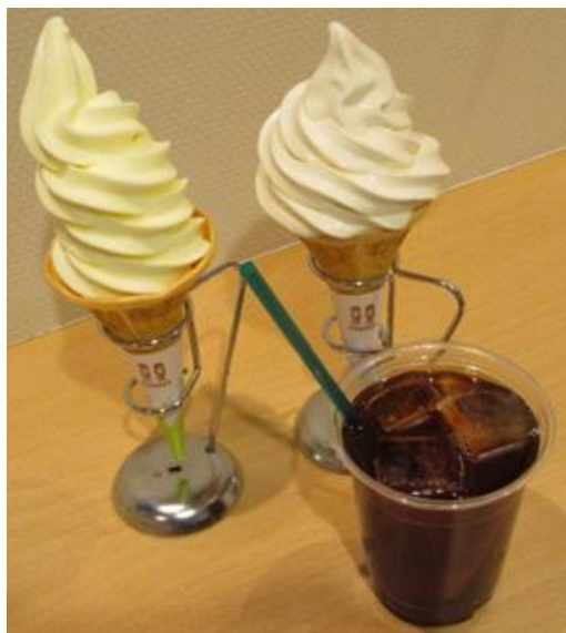
【販売商品イメージ】